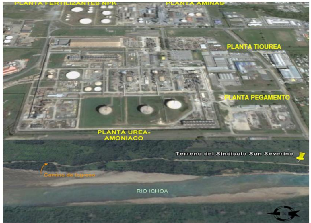
Vista del complejo petroquímico Bulu Bulu, en Carrasco, Cochabamba.

El proyecto para la instalación de una planta de urea amoniaco en Carrasco fue elaborada por técnicos de la GNI y de PEQUIVEN de Venezuela, el año 2008 con el título de "Estudio de Factibilidad para una Planta de Urea-Amoniaco en Carrasco Tropical", para producir 600.000 TM/año de amoniaco y 726.000 TM/año de urea para consumo nacional aprovechando el metano producido en las plantas de separación de la región y que estaba siendo reinyectado por falta de un gasoducto de exportación. Las tecnologías escogidas fueron KBR de USA para el amoniaco y TOYO del Japón para la urea granulada. La inversión de 1000 MM dólares debía ser financiado por la Sociedad Mixta YPFB/PEQUIVEN; los indicadores económico-financieros eran: TIR=14%; VAN=30 MM dólares. La documentación completa del proyecto de factibilidad, incluyendo los términos de referencia para la licitación del IPC, fue enviada a Presidencia de YPFB en La Paz en Junio 2010 para su licitación. Luego de dos años de retraso, recién el 13 de