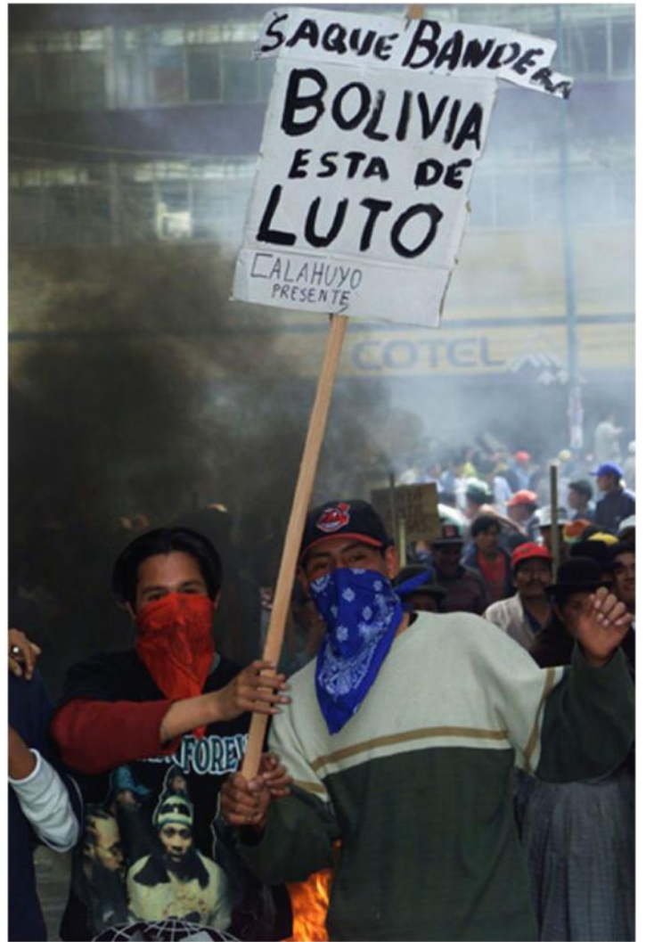
«¿Hacia dónde fue la revolución?: Se encapsuló, se la vendió como discurso y se la convirtió en un fetiche. Uno que compraron intelectuales de clase media progresista, intelectuales de izquierda que replantearon sus objetivos y propósitos para seguir "ayudando" en el "fortalecimiento" de aquellos indígenas que necesitan apoyo "técnico"...»

La revolución se convirtió en mercancía. Casi de igual modo que las poleras estampadas con la cara del Che que los jóvenes compran pensando que al