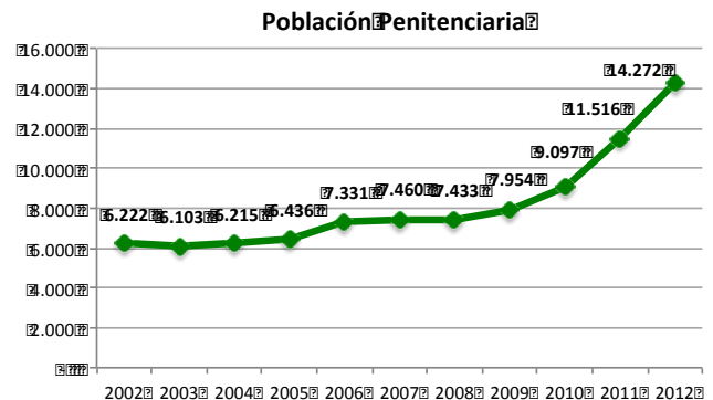
Gráfico N° 1. Población Penitenciaria en Bolivia (2002-2012)

Fuente.- Dirección General de Régimen Penitenciario