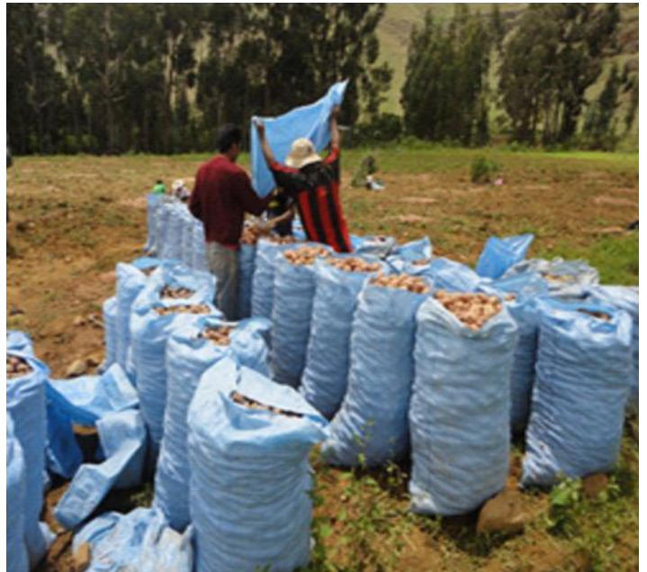
Cochabamba es el primer productor de papa en Bolivia. En la foto, la papa embolsada durante la cosecha, en un lugar del valle cochabambino.

Observando la superficie y la producción conjunta de los productos agrícolas del país, nos permite visualizar que el producto estrella constituye la soya