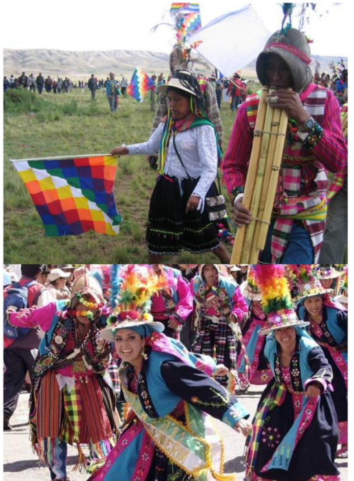
La música y danza que era exclusiva de las comunidades rurales, impera ahora en los centros urbanos, pero a costa de modificaciones. ¿Alienación colonial o adaptación de la identidad indígena a nuevos contextos?

De todas estas características la que más ha sido desarrollada es el carácter popular del folklore, tema que ha sido analizado y discutido en Latinoamérica por García Canclini y Joaquín Bruner, entre otros. Algunos de estos investigadores y otros influidos por la escuela neomarxista y principalmente por Gramsci, han generado literatura abundante sobre el tema de las culturas transnacionales y las culturas populares. Bruner señala al respecto: "ese espacio interior de la cultura popular (folklore) – por lo tanto, su internalización, elaboración, y comunicación como concepción de mundo y de vida, como repertorio de imágenes, de conocimientos, de estructuras de organización subjetivas– este sujeto, además, al insumo de los bienes simbólicos producidos por la industria cultural" (Brunner: 1988: 101).