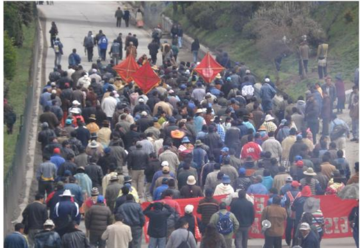
La COB se movilizó una vez más en Bolivia. Esta vez dando definitivamente la espalda al gobierno.

Alain Touraine sostiene que los movimientos sociales poseen tres principios: el principio de identidad, el principio de oposición y el principio de totalidad (Touraine, 1995). Según el autor, el primero permite generar una cohesión interna identificando a sus aliados; el segundo facilita identificar a los adversarios que se oponen a sus demandas y el tercero permite situarse en el contexto histórico en la que se da el movimiento. En esa perspectiva las movilizaciones de la COB tiene el principio de identidad de obreros, principalmente de mineros asalariados, fabriles, maestros, trabajadores universitarios entre otros, aunque los campe-