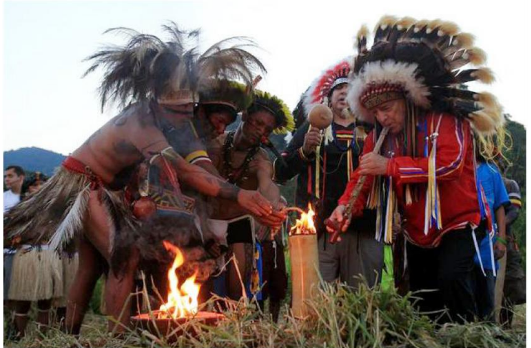
La «cosmovisión andina» para responder a requerimientos extranjeros ha sido adulterada con elementos foráneos. Ese fenómeno, sin embargo, no es solamente local. La simulación y el exotismo para caracterizar lo «indígena» ha llegado a ser norma en actividades sociales y políticas a nivel internacional. En la foto, indígenas de regiones disímiles realizan un espectáculo llamado "Ceremonia del fuego sagrado" el miércoles 13 de junio de 2012, en la Cumbre de Desarrollo Sostenible de la ONU, en la ciudad de Río de Janeiro (Brasil).

Muchos que han interiorizado el auto desprecio buscan ahora rehacer su auto estima con las "armas" de la "cosmovisión andina". Esto es preocupante, pues tal distorsión hace que esos andinos asuman y defiendan una impostura como si fuera nuestra identidad.