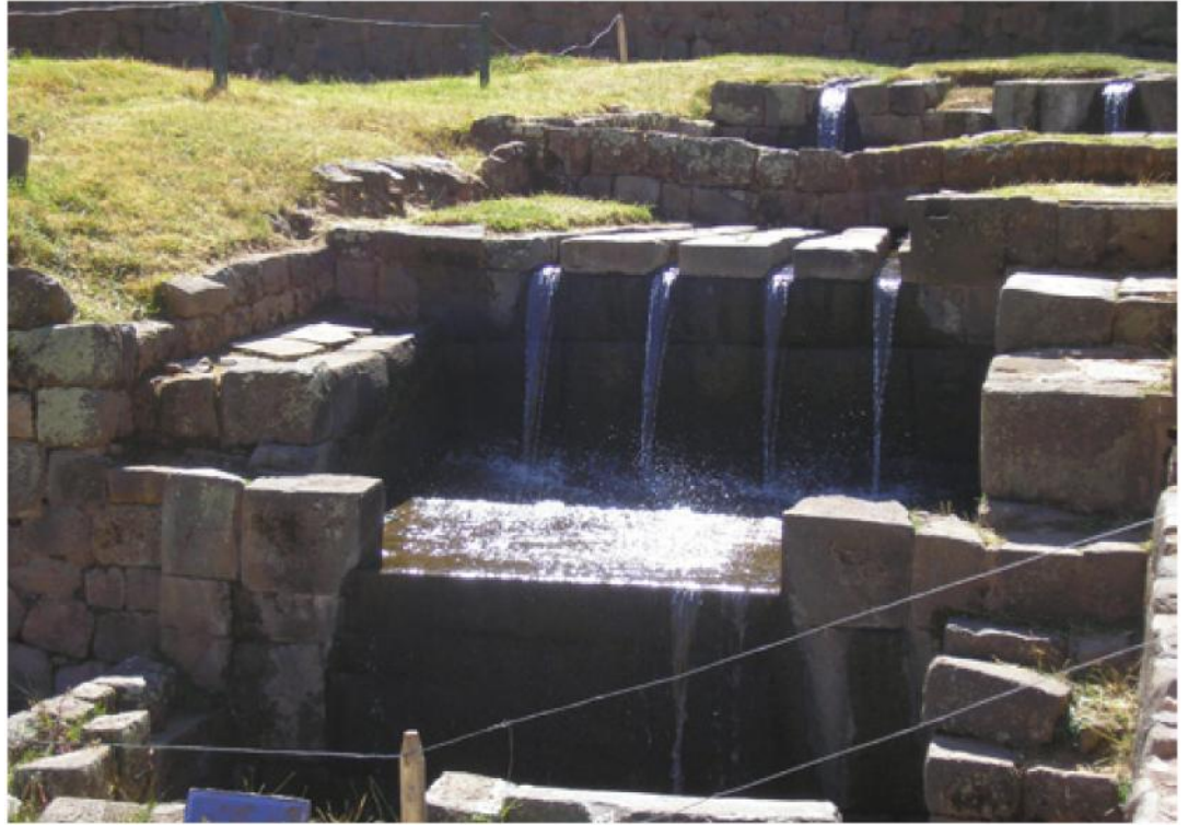
Una muestra emblemática de la sabiduría hidráulica Inca está en Tipón, poblado ubicado a 23 km. al sudeste del Cusco a una altitud de 3,560 msnm, provincia de Quispicanchis. Este complejo ha sido distinguido por la Sociedad Americana de Ingenieros Civiles (ASCE por sus siglas en inglés) como maravilla de la Ingeniería Civil. La grandeza Inca residió en la comprensión de las leyes universales y en su aplicación para el bienestar de su pueblo.

Las teorías pachamamistas (y toda práctica que generan) son en realidad un obstáculo para la verdadera realización de todo pueblo indígena, particularmente de las sociedades andinas en nuestro país, convirtiéndose así en una nueva ideología colonizadora.