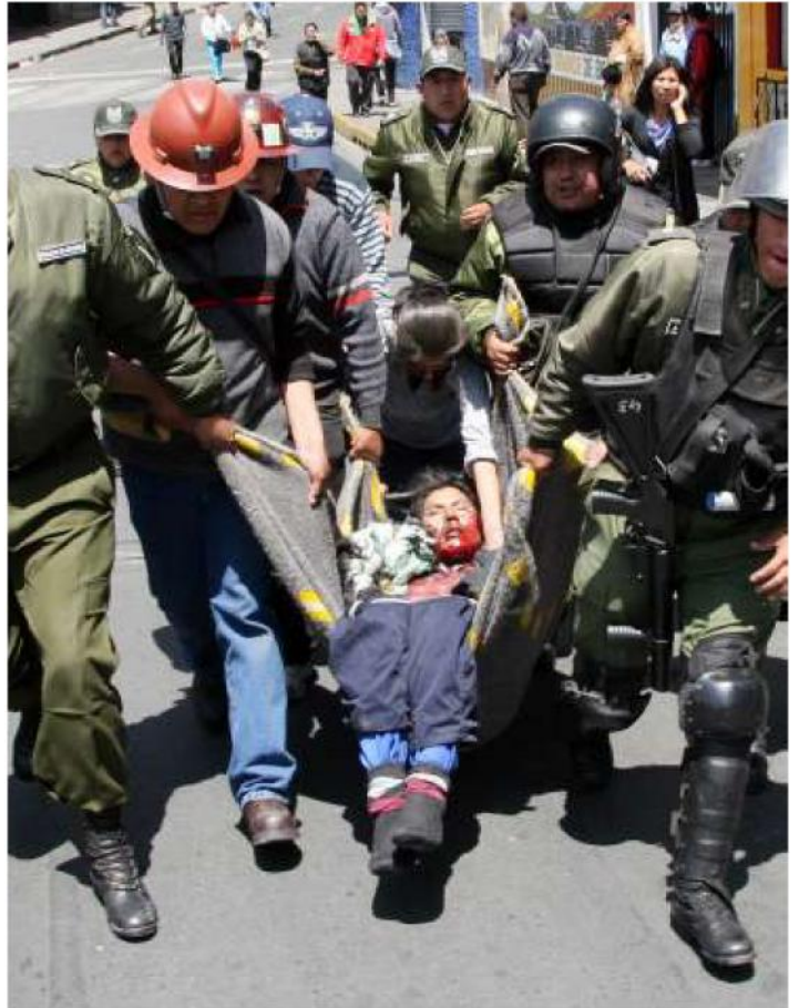
El mes de septiembre, en La Paz, se produjo un ataque de mineros cooperativistas a la sede de la Federación de Mineros del Estado, donde murió un minero asalariado estatal por explosión de dinamita. «Si llega a complicarse más dicho enfrentamiento, será el gobierno el único culpable por su inercia pasada y por la ineptitud de sus actuales operadores políticos».

Pero ya analizando los beneficios que trajo a Huanuni la nacionalización del Posokoni, hoy podemos afirmar que nos benefició en poco o nada, ya que si bien reina la paz, se puede ver que todo lo extraído del Posokoni casi no retornó a su lugar de origen en dividendos que aporten al desarrollo de nuestra capital del estaño boliviano. El gobierno se limitó a entregar obras que muy poco benefician a la población, como ser una hermosa sede sindical, una cancha de césped sintético u otras más, pero no hizo nada por solucionar el lacerante problema del desempleo. Esto jamás fue motivo de análisis del gobierno que aun hoy se conforma con satisfacer las demandas del Sindicato de Trabajadores Mineros, sólo sabe venir a Huanuni con mucha alharaca para "demostrar que los mineros apoyan a su gobierno", cuando muchos sabemos que sólo los dirigentes están de su lado pero no así la gran mayoría de los trabajadores de guarda tojo y ni qué