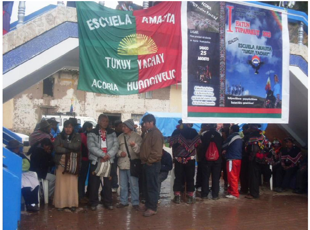
Miembros de la Escuela Amauta Tukuy Yachay, en Acoria, Perú. Es un caso interesante de pensamiento ideológico indígena que no rechaza al marxismo como herramienta de análisis, conocimiento y acción, sino al marxismo como una de las ideologías que el criollaje utilizó para menoscabar y oprimir al indio.

En el Perú, y Bolivia la mayor cantidad de personas son