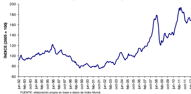
GRÁFICO 1 ÍNDICE MUNDIAL DE PRECIOS DE ALIMENTOS Y BEBIDAS (Junio/1992 - Junio/2012)

La disminución de los precios de los alimentos hasta junio de 2012 se debe a la incertidumbre económica a nivel mundial por la crisis financiera en Europa, la desaceleración económica de los principales países industrializados y emergentes, además de las perspectivas de una oferta de alimentos suficiente a nivel mundial. Las presiones demográficas de países asiáticos y africanos por alimentos sigue elevada, mientras que en los países industriales la demanda de alimentos se mantiene o tiende a la baja. Por tanto, la demanda como oferta de alimentos hizo que los precios internacionales de la mayoría de los productos básicos siguieran sometidos a una presión descendente.