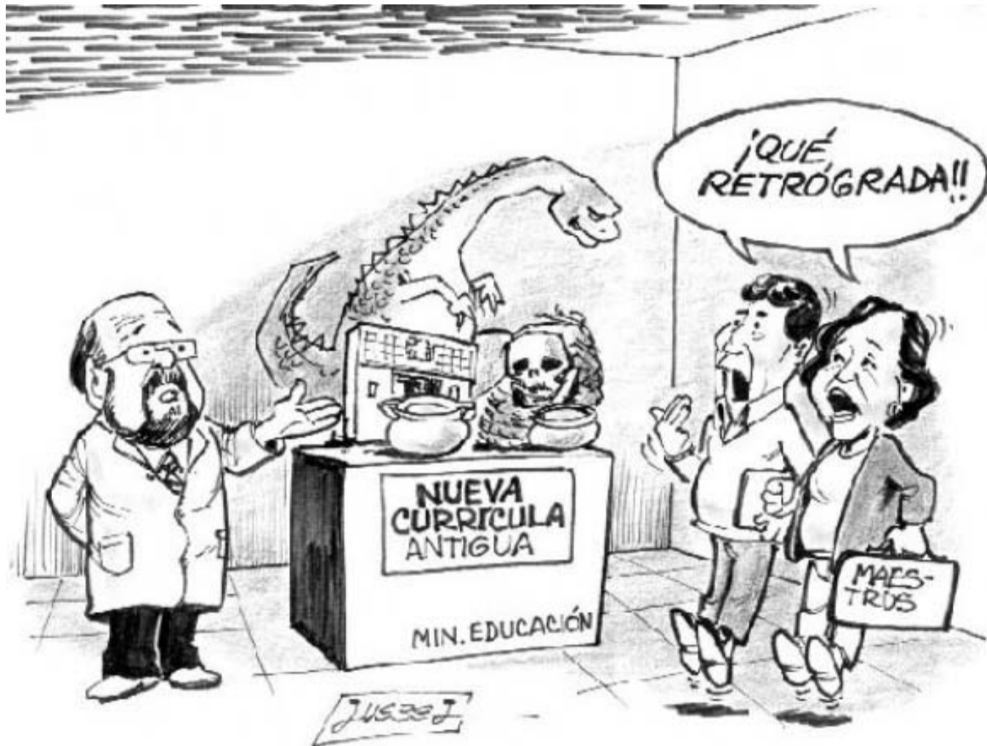
Poses retrógradas se las presenta como si fuese defensa educativa de las culturas indígenas. La actual currícula es objeto de rechazo generalizado.

En el año 2009, en un proceso de traspaso de experiencias para la sostenibilidad de acciones de un proyecto de la UE, tuve la oportunidad de reunirme con el actual Ministro de Educación, Roberto Aguilar, conjuntamente con el que entonces era Director Departamental de Educación de Potosí, le expusimos la experiencia de un proyecto educativo bastante exitoso, denominado Agentes