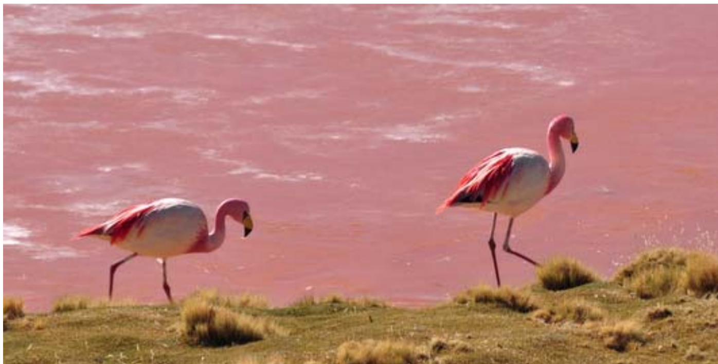
Los humedales de la «laguna Colorada» albergan el flamenco andino ( Phoenicuparrus jamesi ), conocido como chururu. Esta especie animal, junta a varias otras, corre peligro de extinción por la ausencia de políticas prácticas de salvaguarda de los humedales en Bolivia.

No obstante, un asunto que no es tan fácil comprender es que la provisión o suministro de agua depende de la calidad de los ecosistemas, es decir del funcionamiento del ciclo del agua, entonces su gestión no solamente debería tener en cuenta un manejo integral de la